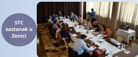
STC sastanak u Zenici

Do kraja trajanja projekata ukupno će biti organizirana četiri sastanka Upravljačkog odbora. Do sada su sastanci održani u Zenici i Ljubuškome (Bosna i Hercegovina), dok će sljedeći biti organizirani u Podgorici i Metkoviću.