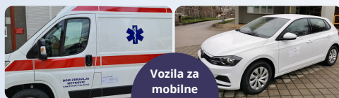
Vozila za mobilne palijativne timove

Projektne partneri nabavljaju opremu koja će omogućiti poboljšanje kvalitete zdravstvene usluge u regiji. Svaki Dom zdravlja, koji je kao partner uključen u ovaj projekt, nabavit će medicinsku, hardversku i softversku opremu te vozila što će imati direktan utjecaj na uslugu palijativne njege.