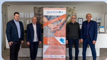
STC sastanak u Ljubuškome